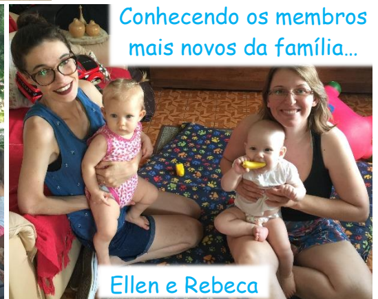
Conhecendo os membros mais novos da família...