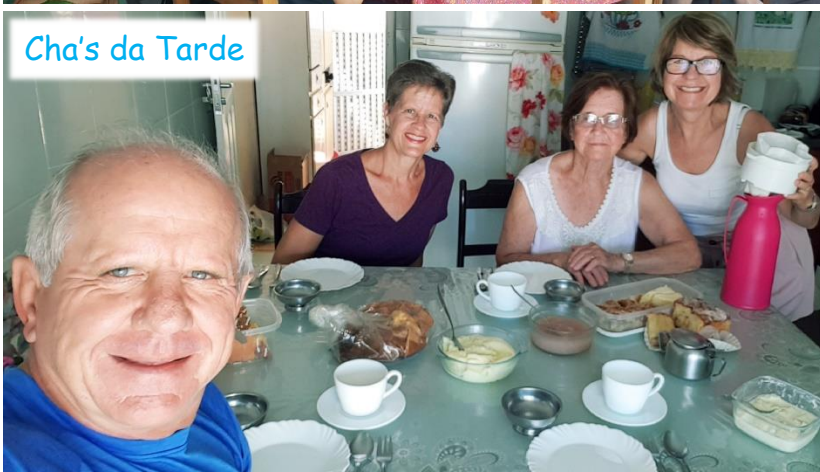
Chá's da Tarde