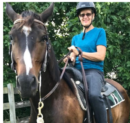
Tivemos tempos divertidos, aventureiros e espontâneos com família e amigos! 😊