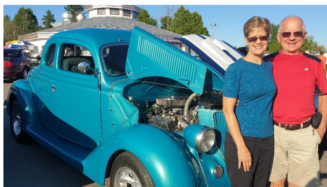
Vendo carros antigos com amigos (à direita)

Logo mais voltaremos ao estado de Illinois por alguns dias para termos um tempinho com nossa filha e seu marido, fazer visitas em Missouri e viajar até Texas por uma semana para ver nosso filho e mais um casal que faz parceria no ministério conosco. Louvamos a Deus mais uma vez por nos dar estes momentos maravilhosos e pelas lembranças preciosas que tivemos nos EUA! Queremos vos agradecer imensamente por nos sustentar fielmente em orações e apoio durante este período intenso de divulgação missionário.