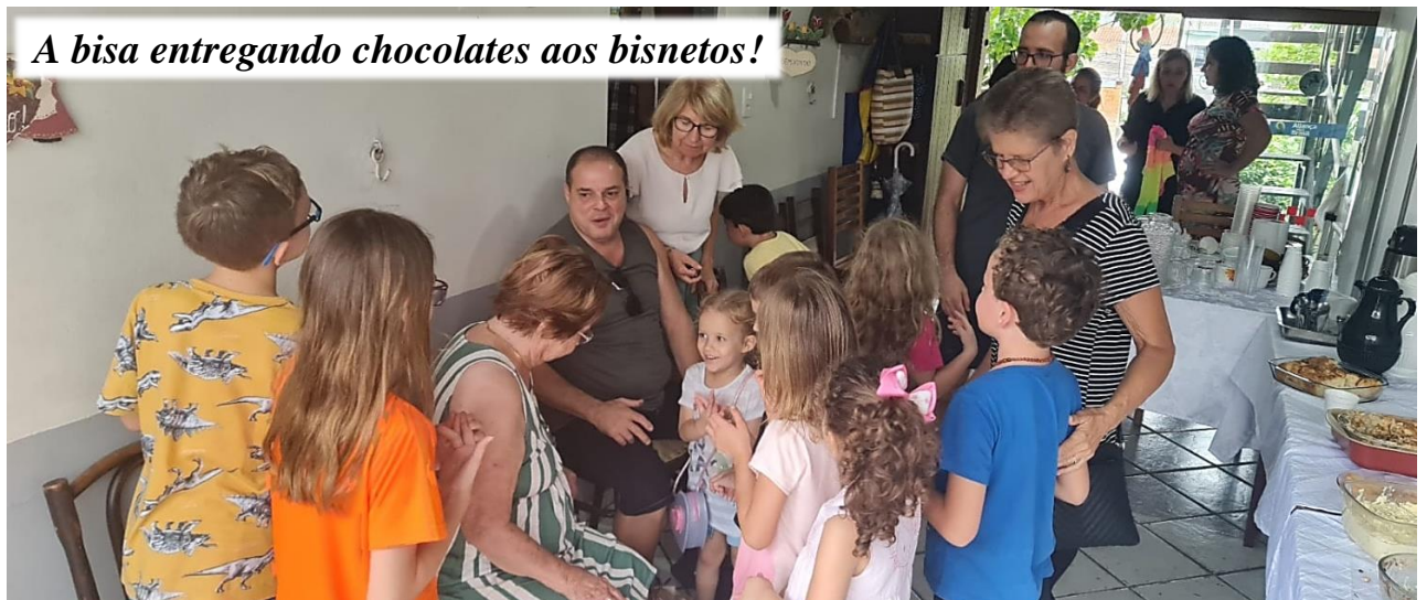
A bisa entregando chocolates aos bisnetos!