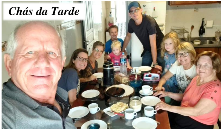
Chás da Tarde

Tivemos deliciosas chás da tarde, um maravilhoso jantar