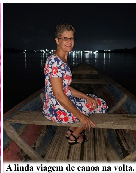
A linda viagem de canoa na volta.