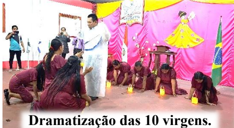
Dramatização das 10 virgens.

Sejam preparados para a vinda de cristo!