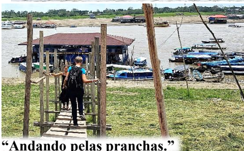
“Andando pelas pranchas.”