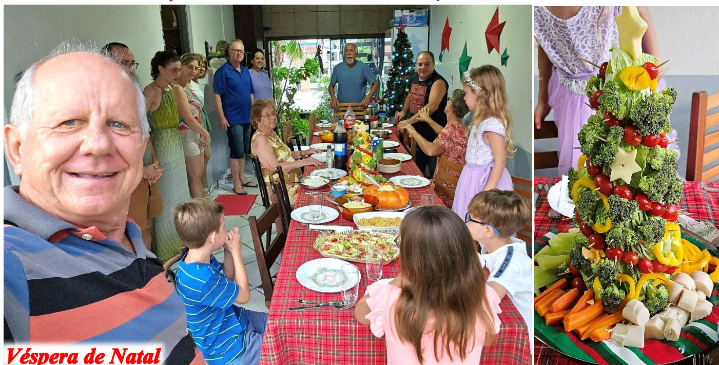
Véspera de Natal