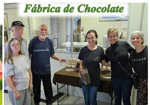
Fábrica de Chocolate