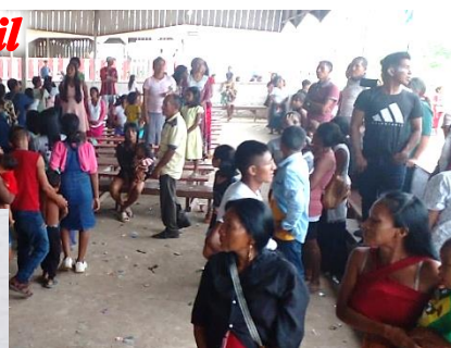
São José, Brasil