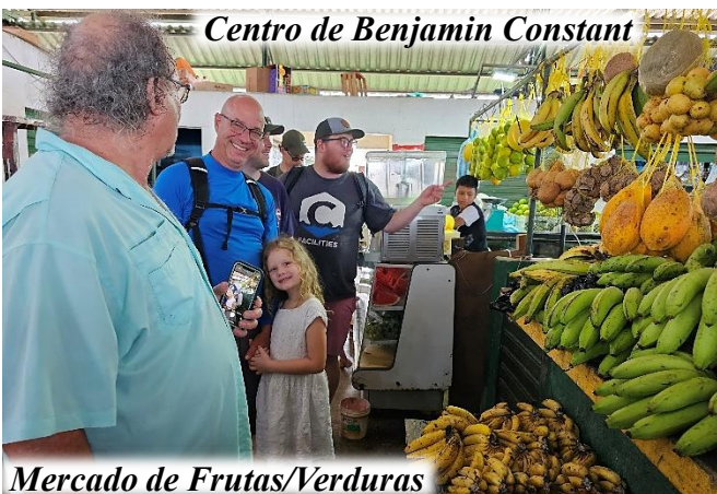
Centro de Benjamin Constant

Outras atividades da equipe incluíram um passeio pela nossa base missionária, uma viagem a Atalaia do Norte para visitar outra família missionária e aprender sobre seu ministério com os índios Matis, um passeio pelo centro de Benjamin Constant e um dia de lazer e confraternização em nossa casa, onde também tivemos uma reunião para compartilhar metas futuras e responder perguntas da equipe.