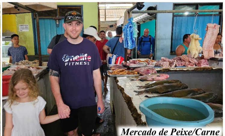
Mercado de Peixe/Carne