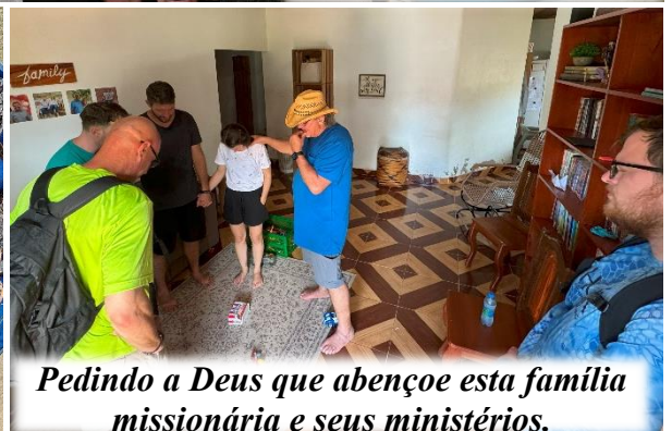
Pedindo a Deus que abençoe esta família missionária e seus ministérios.